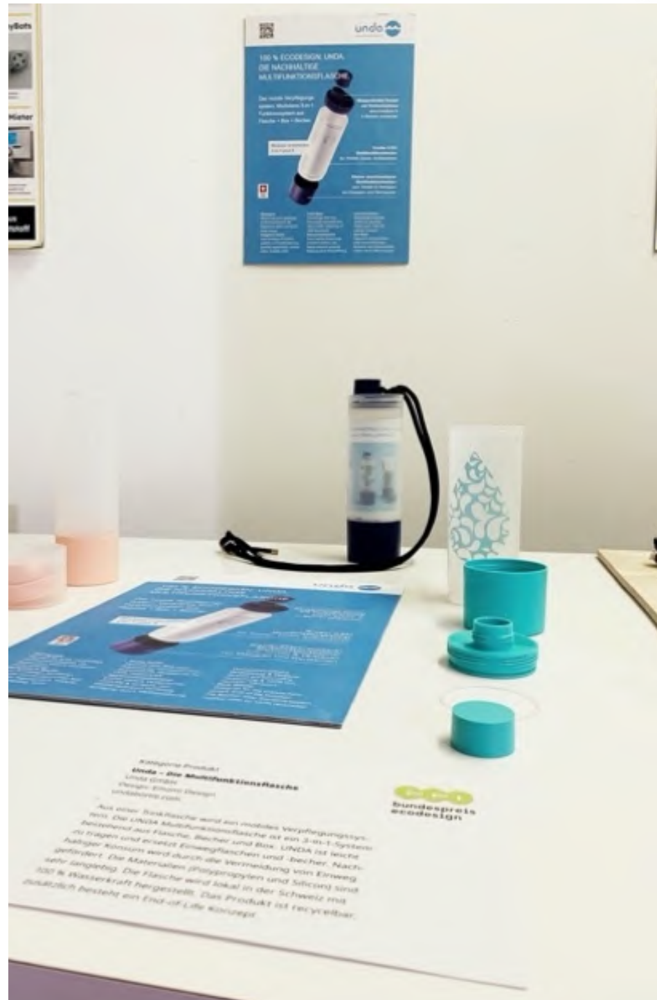
UNDA @Ausstellung für Bundespreis Ecodesign