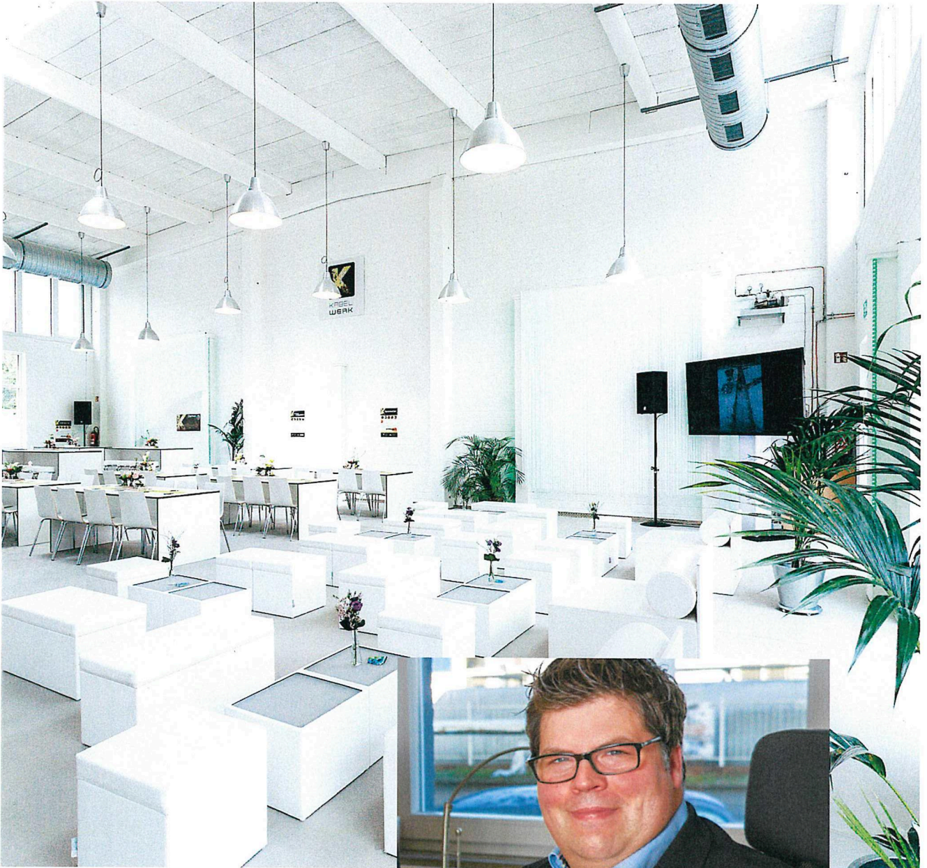
Event-Möblierung aus dem Eventura-Fundus